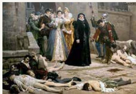
Е. Медичи осматривает трупы гугенотов.

Говорят, что в те дни королева Екатерина Медичи изрекла: «Быть с ними жестокими — человечно, а быть милосердными — жестоко».