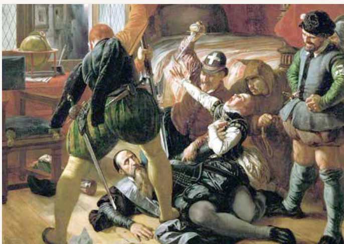
Варфоломеевская ночь.