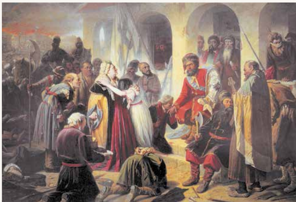
Суд Пугачева. Художник В. Г. Перов. 1879 г.

Многие дворяне, чиновники и офицеры были убиты.