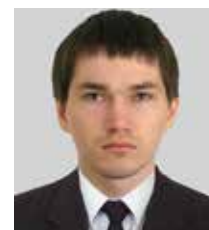
Андрей Олегович ШИКУНОВ,

Abstract. The article is devoted to the analysis of problems of procuratorial supervision over the implementation of laws in the course of operational detection at the present stage, in particular the relationship of goals and tasks